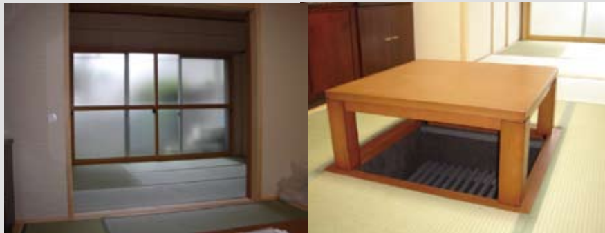
寝室として使う和室は二重サッシにしてとても静かなお部屋に・・・ 掘りごたつを設置できるように床を造作

Kitchen Reform Kitchen Reform Kitchen Reform Kitchen Reform Kitchen Reform Kitchen Reform Kitchen Reform