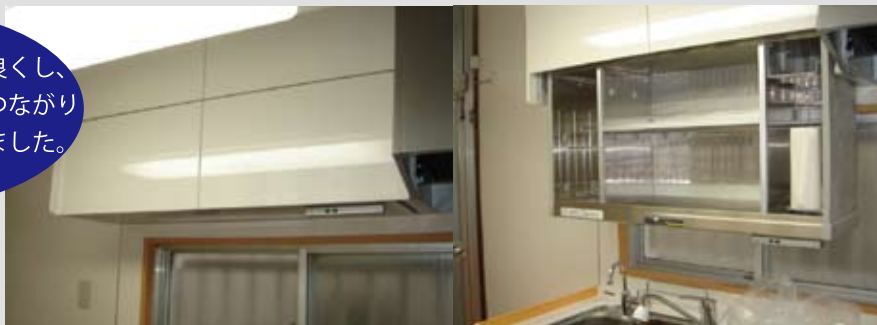
自動昇降タイプにしてキッチン上部を有効に活用！