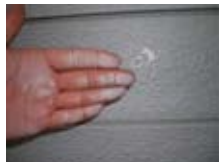
↑さわった際に白い粉がつく。(チョーキング)