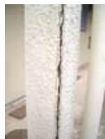
←こうなるとコーキング処理だけでは追いつきません。