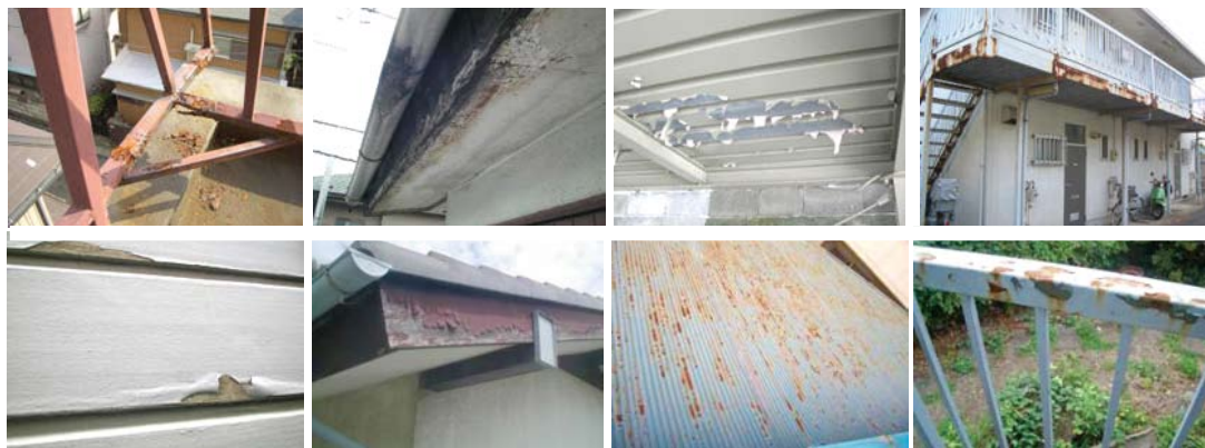
鉄部のサビ・塗装はがれ・軒裏の腐食

水はけの悪いところや湿気の多いところは、劣化の速度が非常に早くなります。サビが発生すればするほど、下地処理に多くの手間とコストがかかりますので、早めの対応をおススメ致します。適切な対処をすることで、塗り替えリサイクルを長期化することも可能になります。