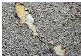
↑塗膜の膨れや剥がれ