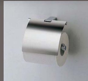
シンプルなアクセサリ類

お部屋を決める際に特に女性が気にされるのがトイレや洗面脱衣室等の水まわり空間ではないでしょうか？ 内装材やアクセサリ類のちょっとした工夫で清潔感のある空間をお作りします！