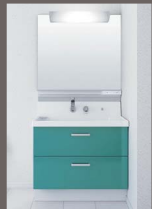
洗面化粧台の扉カラーはピーコックブルー 壁のアクセントクロスとコーディネートしました

←工事をご依頼いただきましたお客様には、ご希望の場合、募集広告作成のサポートもおこなっております。ご入居が決まるところまでお付き合いさせていただきたいという思いからお作りしております！！