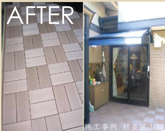
施工事例 杉並区丁郎

タイル敷きの中庭にウッドパネルを敷いて、部屋の掃き出し窓にオーニングを設置した事例です。施工前は直射日光によるタイルの照り返しがきつかったようですが、オーニング設置により日射しをさえぎる日陰が出来て、人にも植物にも優しい空間ができました。