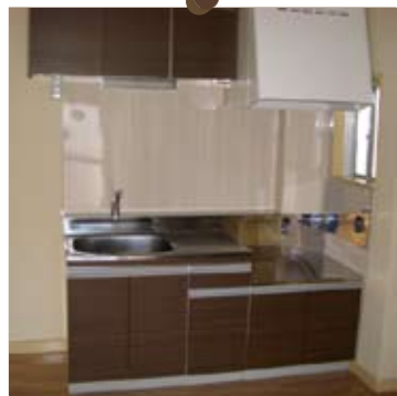
after キッチン扉（吊戸棚含む） 硬質塩ビシート貼り 一式・・・¥42,200（税抜価格） ※参考価格です。材柄・補等の工事費は含まれません

キッチン・・・まだまだ使えるけどクリーニングをしただけではパツとしない。そんな時、扉に塩ビシート貼りを施すことでイメージが一新します。今回は2つの事例をご紹介します。